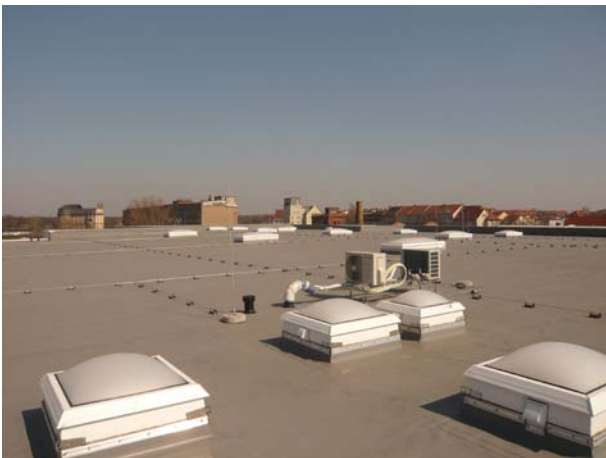
Schedetal SystemFlachdach in Leipzig.