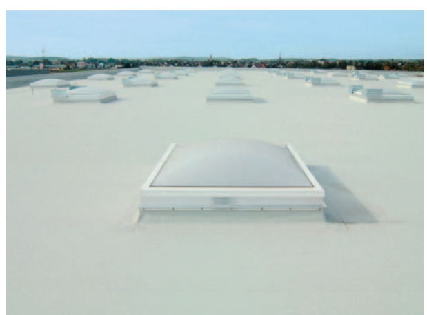
Schedetal SystemFlachdach in Nürnberg.