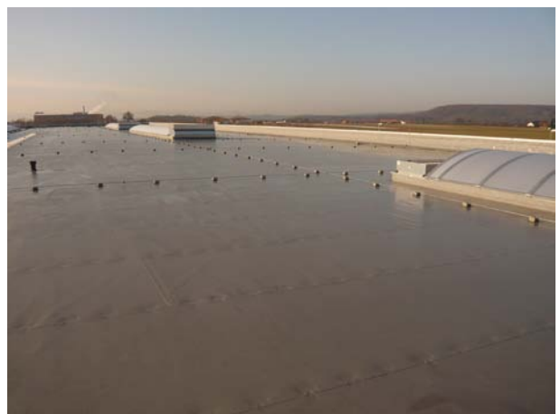
Schedetal SystemFlachdach in Filderstadt.