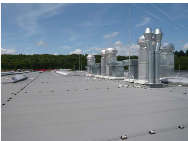
Schedetal SystemFlachdach in Stuttgart.